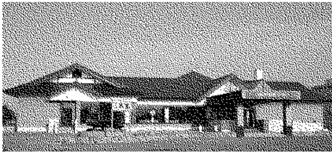
▲妹背牛温泉ペベル外観