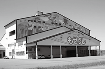
▲米穀乾燥調製貯蔵施設