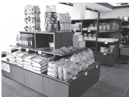
入口横の売店コーナー