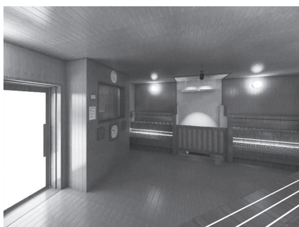
屋内サウナ：クンネの湯