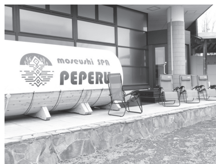
バレルサウナと外気浴スペース