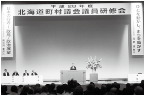
▲北海道町村議会議長会議員研修会