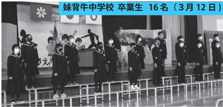
妹背牛中学校 卒業生 16名 (3月12日)