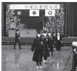
妹背牛小学校 卒業生 19名 (3月18日)