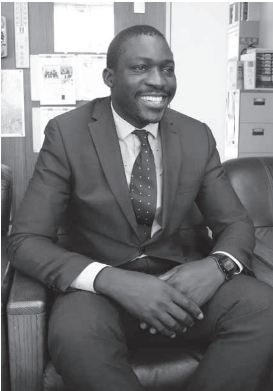
さわやかな笑顔でインタビューに応じるカレッジさん