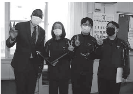
中学校の生徒たちとも仲良し