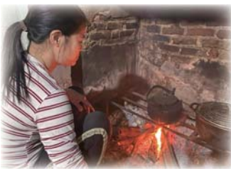
やかんでお湯を沸かす風景

子どものころ、私は早く成長して、自分のやりたいことをして、自由な生活を送りたいといつも思っていました。