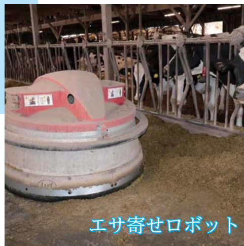
エサ寄せロボット

エサ寄せロボットは、牛がいつでもエサを食べられるよう牛舎内を往復し、柵から顔を出す牛にエサを近づけます。少しの衝撃で緊急停止するため、誤って牛とぶつかっても安全です。 24時間体制で1時間に1回稼働します。特に活躍するのが、暑さで食欲が落ちてしまう夏場。日中に食べられなくなった分、涼しくなる夕方や夜にエサを食べる牛の食事を支えます。 腸と肝臓の健康に気を配り、エサに乳酸菌を配合。腸内環境を整え、自己免疫力が高まると、乳房炎は6、7割減りました。