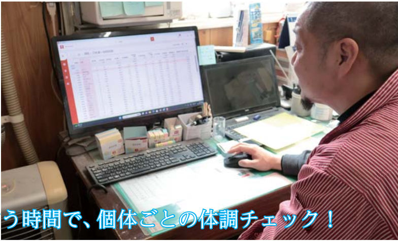
反すう時間で、個体ごとの体調チェック！

搾乳ロボットは空知管内で妹背牛牧場が唯一導入しており、効率的・省力的な酪農経営の先駆けとなっています。