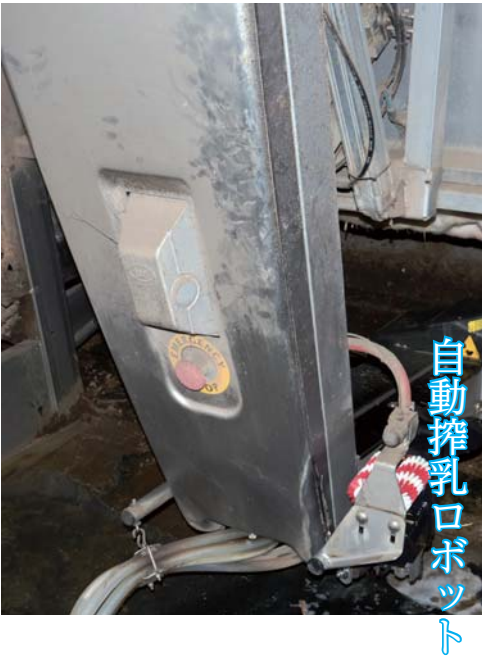
自動搾乳ロボット

※反すう→飲み込んだ食べ物を口の中に戻して咀嚼 そしゃく すること。 微生物の働きを活発にして胃や腸内環境を整えます。