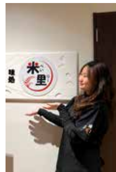
妹背牛温泉ペペルのレストラン「米里」で働くアインさん

このインターンシップ制度は日越の架け橋となり、北海道に興味を持つ外国人大学生の受け入れに期待されています。