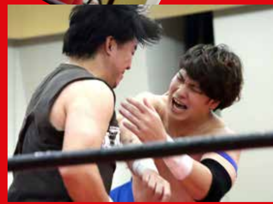
12月3日 まちおこしプロレス