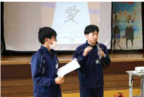
いじめのない学校生活に必要な ことを漢字で表現する生徒たち

妹背牛町教育委員会は11月22日、人間関係について考える「小中学校交流いじめ撲滅集会・町内いじめ根絶フォーラム」を中学校の体育館で開きました。 小学5年生から中学3年生までの各班はグループワークで、相手を傷つけない話し方について意見交換。いじめのない学校生活に必要なことを漢字一字で表すテーマでは、「愛」「絆」「仲」などを組み合わせた造語を考え、各班の代表者がその理由を発表しました。