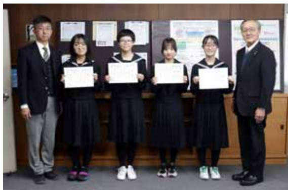
受賞された中学生の皆さん