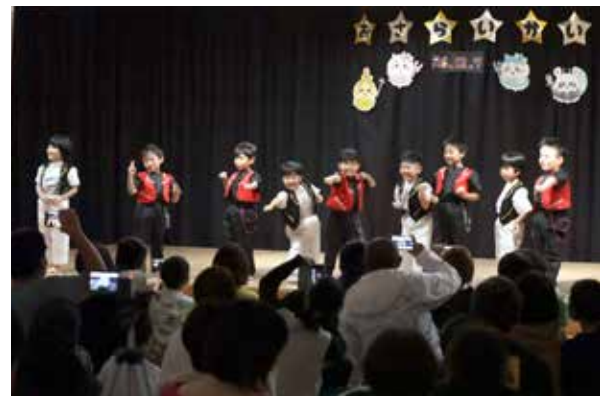
保護者の前で元気いっぱい 遊戯を披露する園児たち

認定こども園妹背牛保育所の「おさらい会」が12月7日、園舎ホールで開かれ、この日のために練習を続けてきた園児たちが元気いっぱい遊戯を披露し、訪れた父母や祖父母らを楽しませました。 クラスごとの発表では、ステージ上で縄跳びを続けたり、リズムカルな音楽に合わせて軽快に踊ったり。かわいらしい姿をビデオカメラに収めていた保護者たちは、我が子の成長ぶりに目を細めていました。