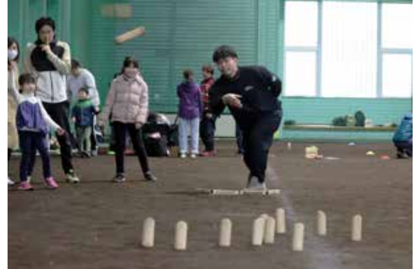
狙いを定めて、木の棒を投げる参加者

フィンランド発祥のニュースポーツ「モルック」の北空知大会が11月、妹背牛町農業者トレーニングセンターで初めて開かれ、空知管内の24チーム・80人がゲームを楽しみました。 妹背牛近郊の愛好者でつくる「KAWAMOOKY Crew」が、木の棒を投げて木製ピンを倒すモルックの楽しさを広めようと企画。家族や友人と参加した各チームは、和やかな雰囲気の中で得点を競い合いました。