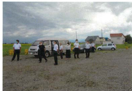
現地視察の様子（妹背牛商業高校跡地）