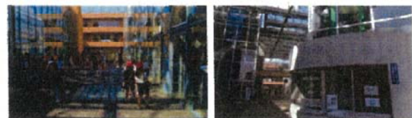
見通しのよいガラス張りの校舎