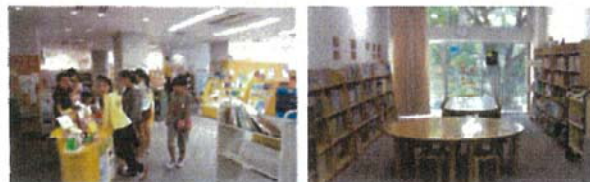
児童による貸出し業務体験もできるなど、複合した公共図書館を利用する児童が多い