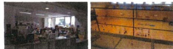
公民館の入口にある受付で利用者を確認