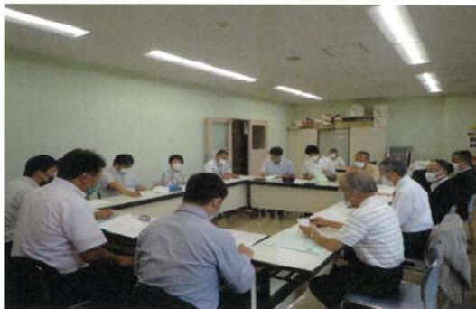
検討委員会の様子