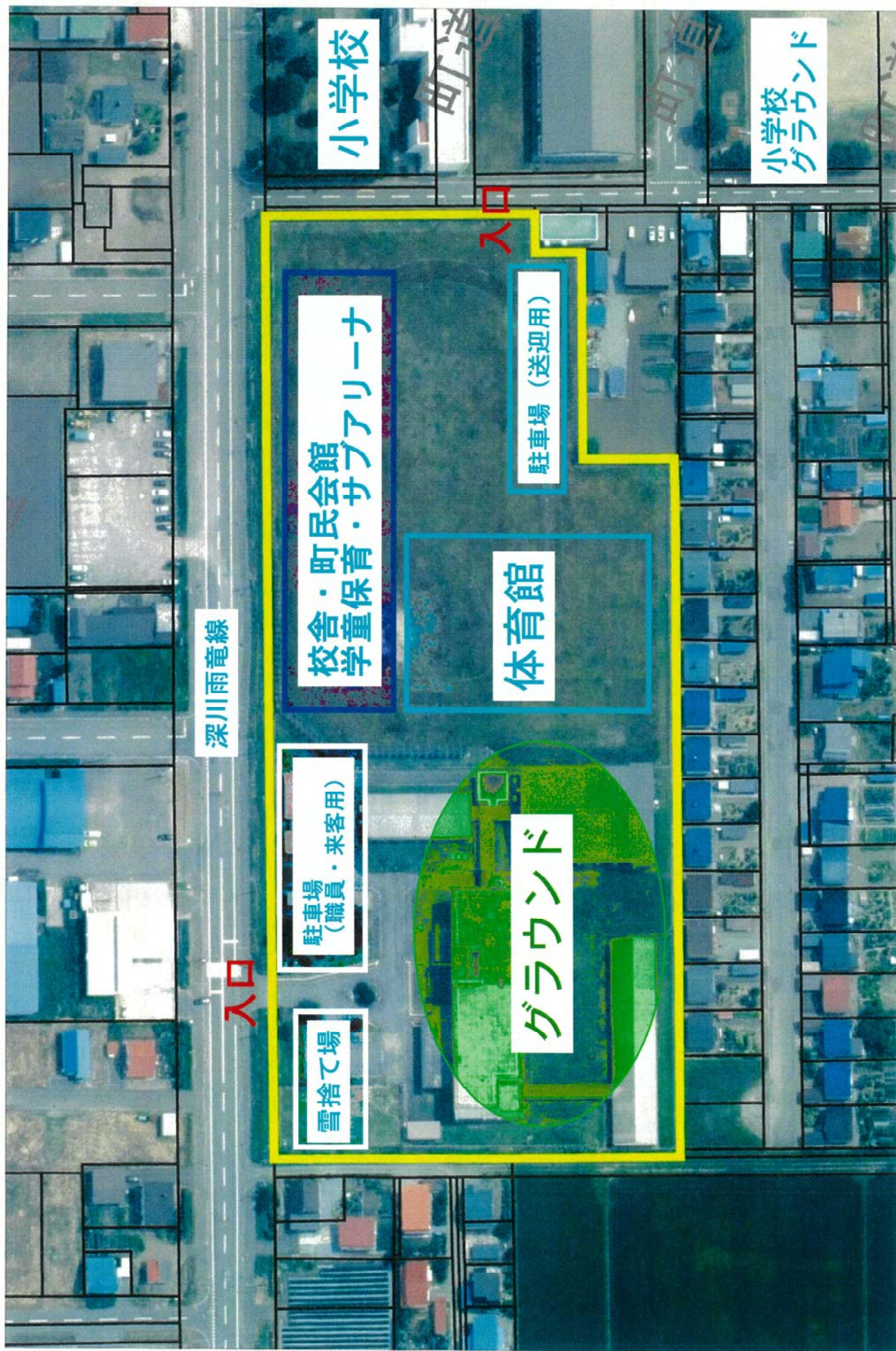
高校跡地の場合 未定稿 (イメージ図)