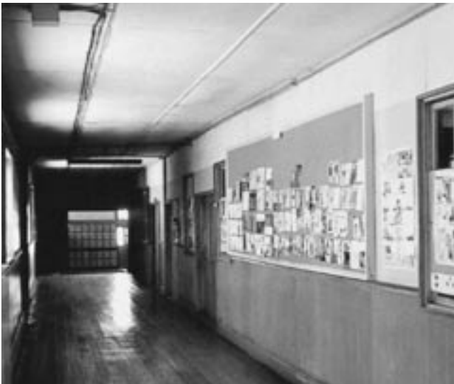
生徒玄関へ向う風景 (昭和60年卒業アルバムより)