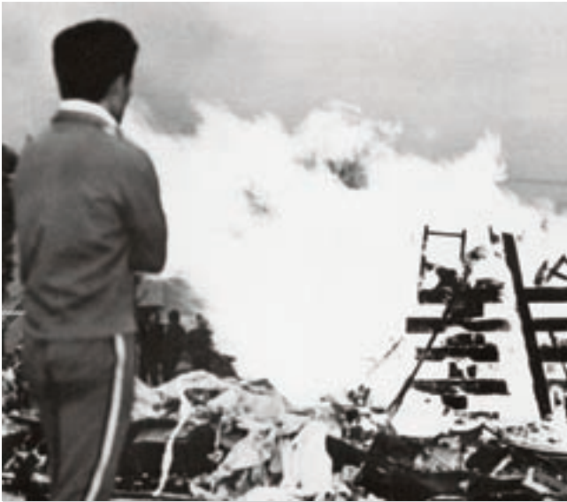
ファイアーストーム（昭和47年卒業アルバムより）