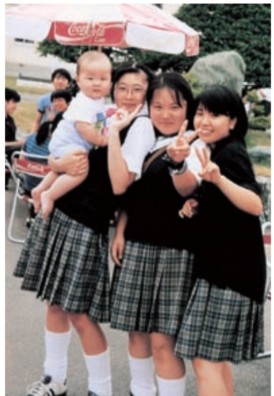
赤ちゃんだっこ (平成10年卒業アルバムより)