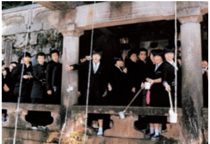
清水寺 (昭和57年卒業アルバムより)