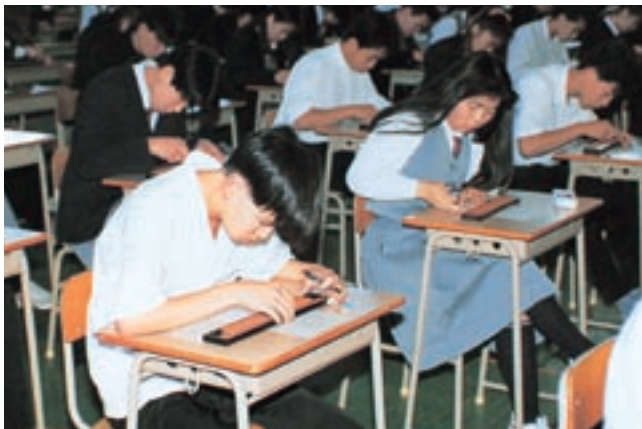
そろばん (平成4年卒業アルバムより)