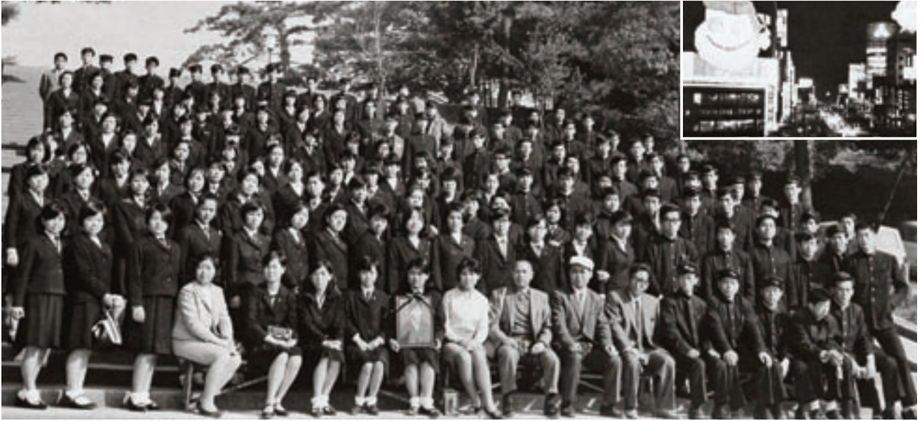
修学旅行（昭和44年 卒業アルバムより） 銀座の夜景（右上）