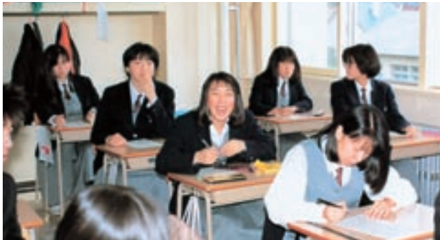
笑み (教室) (平成2年卒業アルバムより)