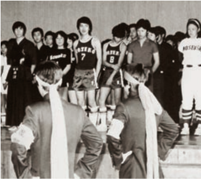
壮行会 (昭和52年卒業アルバムより)