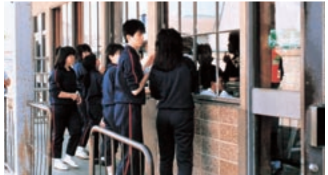
ターミナルボランティア (昭和63年卒業アルバムより)