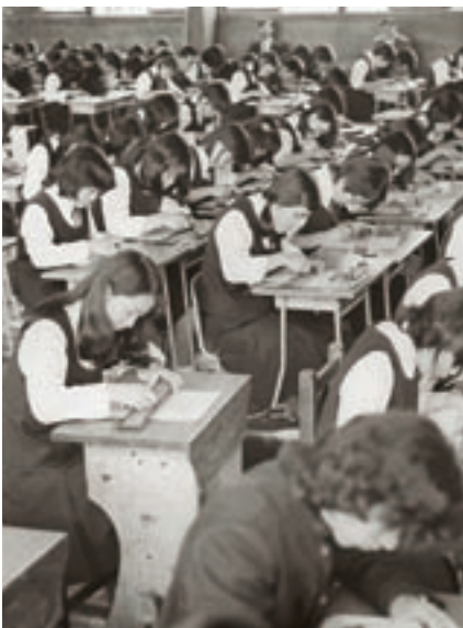
校内珠算競技大会（昭和50年卒業アルバムより）