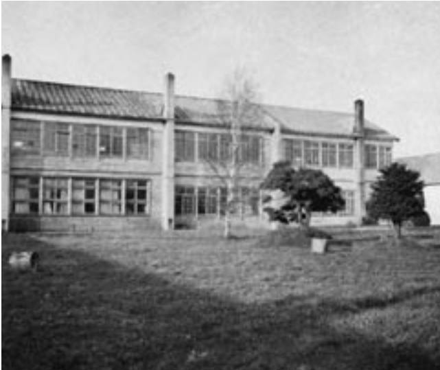
中庭からの風景 (昭和54年卒業アルバムより)