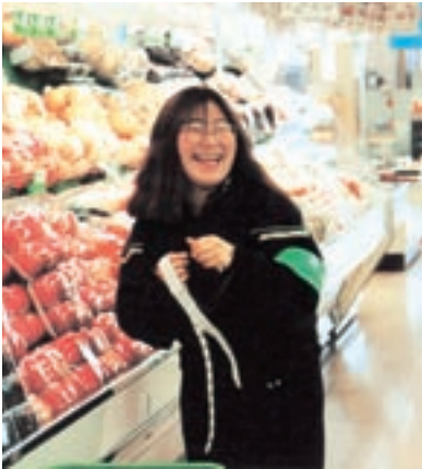
実習 (平成6年卒業アルバムより)