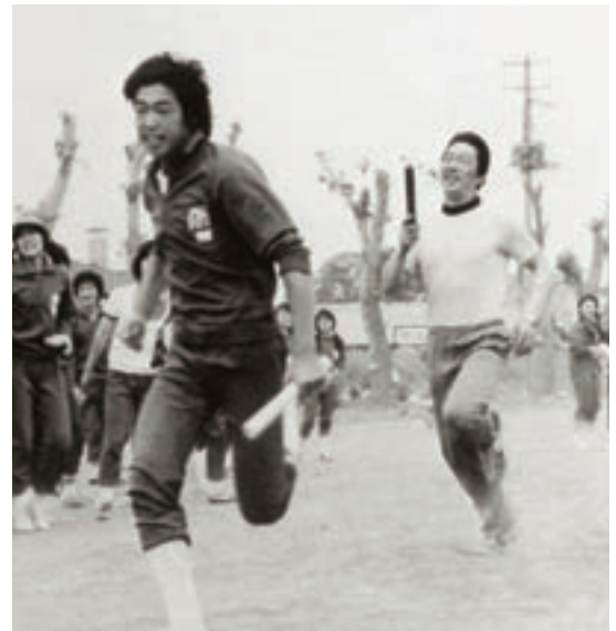
体育大会リレー (昭和52年卒業アルバムより)