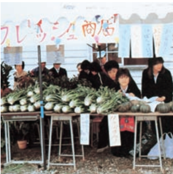
実習即売会「野菜売店」 (昭和60年卒業アルバムより)