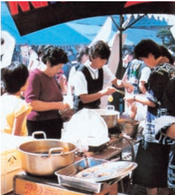
学校祭「ときび」 (昭和58年卒業アルバムより)