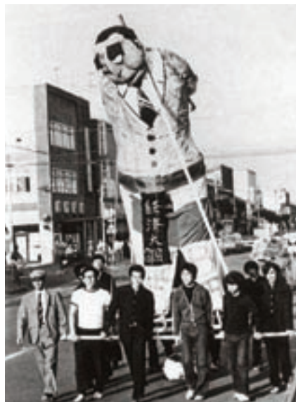
行灯（昭和47年卒業アルバムより）