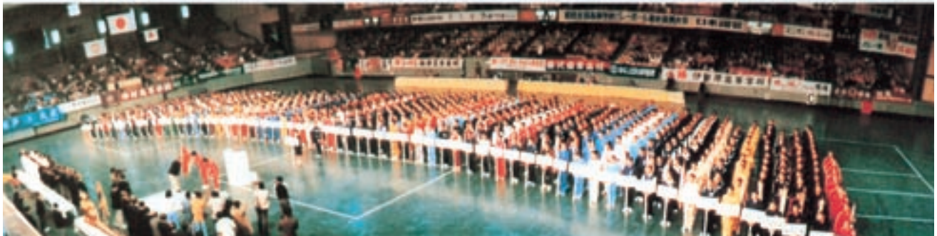
全国バレーボール選抜優勝大会