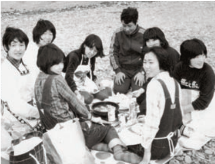
遠足 (昭和54年卒業アルバムより)