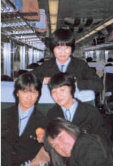
4人組 (昭和56年卒業アルバムより)