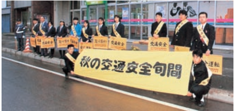
交通安全 (平成5年卒業アルバムより)