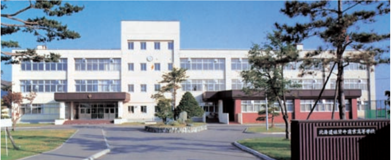
新校舎 (平成7年卒業アルバムより)