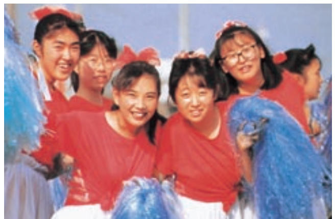
5人組 (平成3年卒業アルバムより)