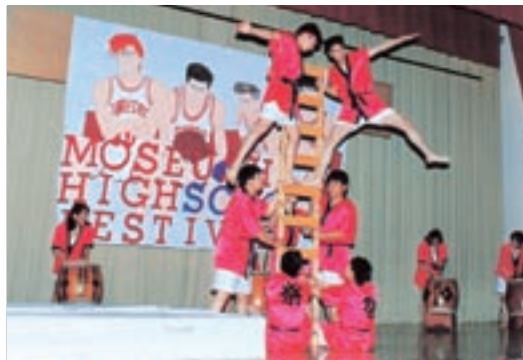
学祭ハシゴ (平成7年卒業アルバムより)