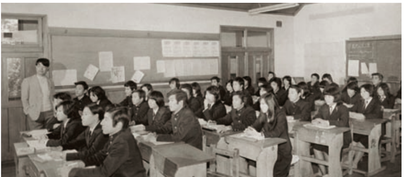
授業風景 (昭和50年卒業アルバムより)