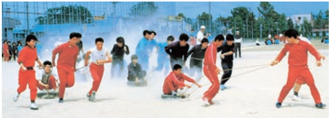
体育祭 人間バンパ (昭和62年卒業アルバムより)