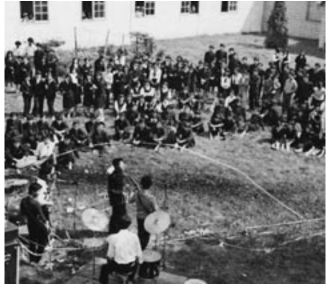
中庭でのコンサート（昭和46年卒業アルバムより）