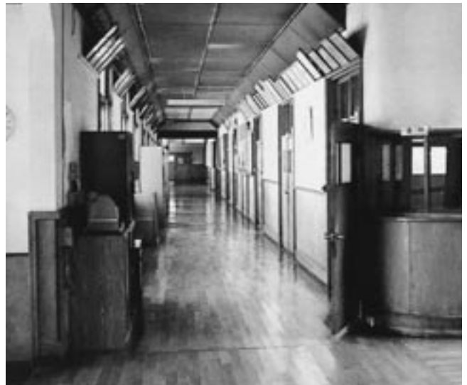
事務室前からの風景 (昭和60年卒業アルバムより)