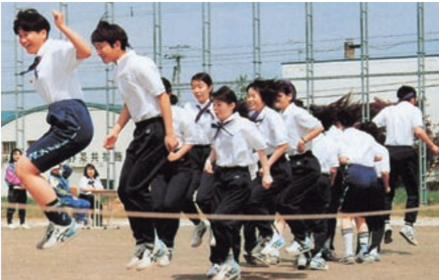
なわとび (平成9年卒業アルバムより)