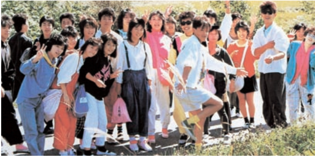
遠足 (昭和61年卒業アルバムより)