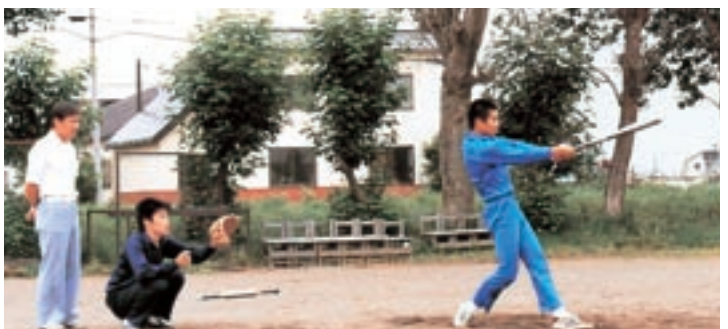
ソフトボール