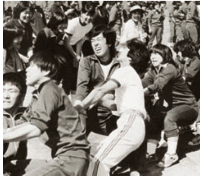
体育大会 (昭和53年卒業アルバムより)