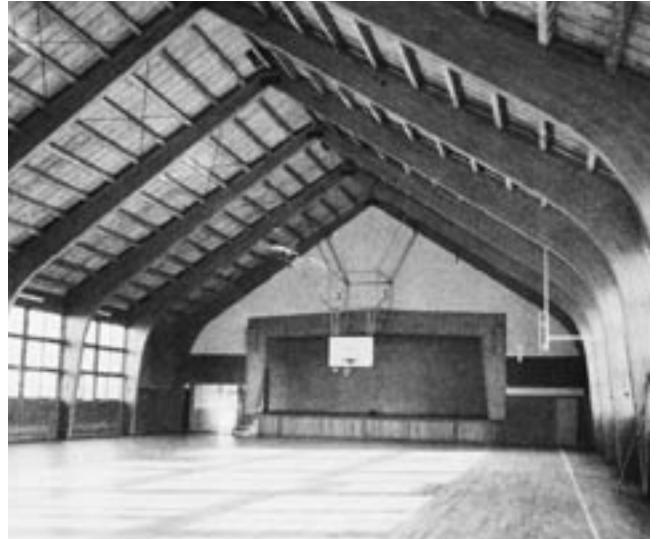
旧体育館 (昭和54年卒業アルバムより)