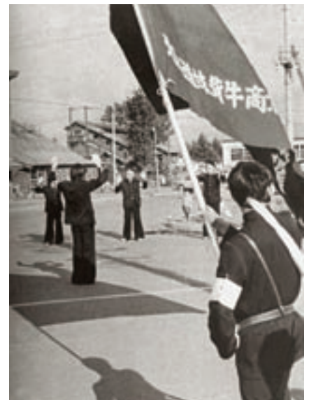
学校祭 応援団（昭和48年卒業アルバムより）