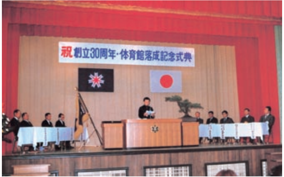
体育館落成 (昭和55年卒業アルバムより)