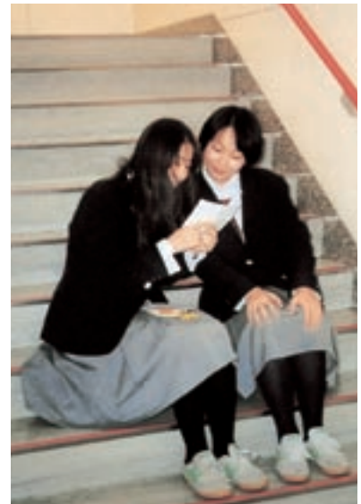
階段のふたり (平成8年卒業アルバムより)